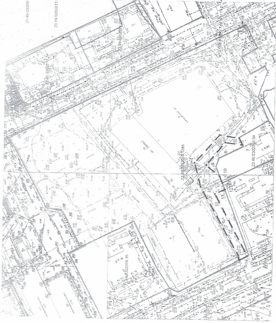
Схема расположения границ публичного сервитута для обеспечения прохода и проезда через часть земельного участка с кадастровыми номерами 23:49:02302010:1285, расположенного по адресному ориентиру: край Краснодарский, г. Сочи, р-н Хостинский, пр-кт Курортный

Приложение к постановлению администрации муниципального образования городской округ город-курорт Сочи Краснодарского края от 23.06.2021 № 1194